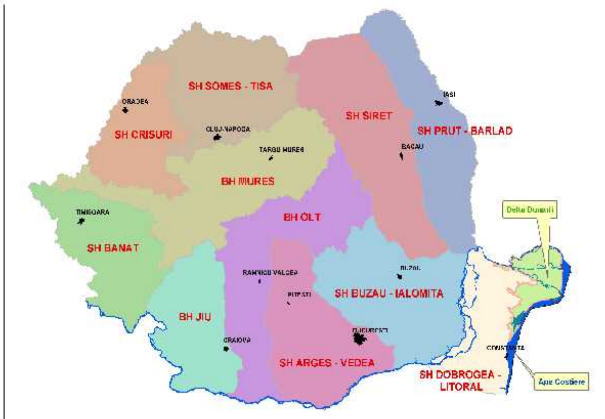
Fig. 2.2 Bazinul / Spațiile hidrografice și Apele Costiere pe care se elaborează Planurile de management

prezintă o sinteză a programelor de monitoring pentru apele de suprafață și pentru cele subterane în conformitate cu cerințele Directivei Cadru pentru Apa. Raportul privind Sistemul Național de Monitorizare al Apelor din România reprezintă o sinteză a programelor de monitorizare pentru cele 11 bazine/spații hidrografice pentru care se elaborează Planurile de Management în România (vezi harta).