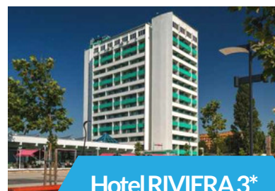
Hotel RIVIERA 3*