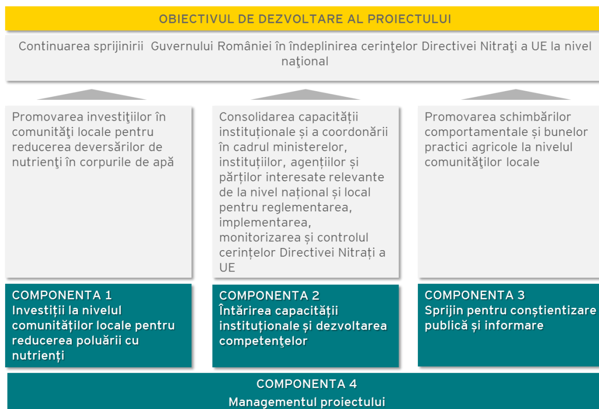
Figura 1: Obiectivele și componentele INPCP-AF

INPCP-AF reprezintă o extindere a proiectului INPCP, cu mici modificări. Proiectul se implementează în perioada 2017 – 2022 și va acoperi întreaga țară, luând în considerare specificitățile locale în ceea ce privește diferitele sisteme de creștere a animalelor și regiunile agro-ecologice.